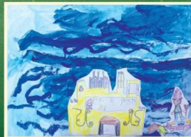
Yoni, 7 years | יוני, 7 בן

כרטיס תרומה: כרטיס ליחיד 300 ₪ | כרטיס לזוג 500 ₪ Donation tickets: Single ticket 300 ₪ | Ticket for two 500 ₪